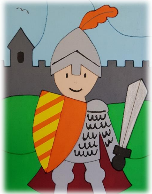
Ritter (21 Teile)