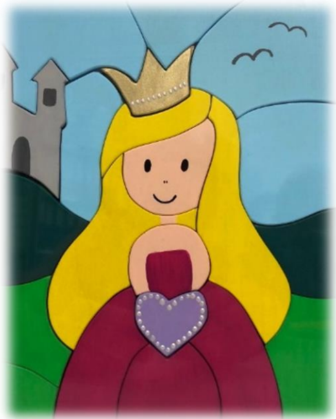
Prinzessin (21 Teile)